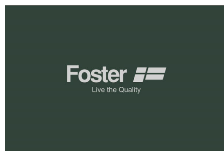
Kohlefilter-Kit 9700 221