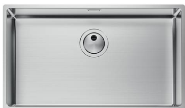
Spülbecken S4001 3138 850