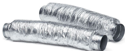
Kanalisierung flex schalldämpfend Ø 120 9700 602