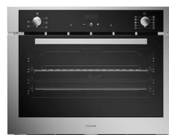
Backofen KE 75 7137 000