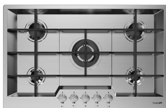
Kochfeld KE 7602 032