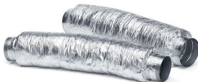
Kanalisierung flex schalldämpfend Ø 150 9700 603